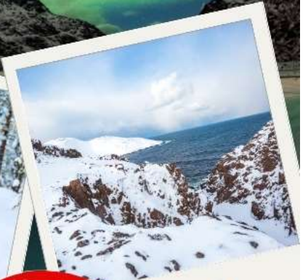
เทอริเบอก้า