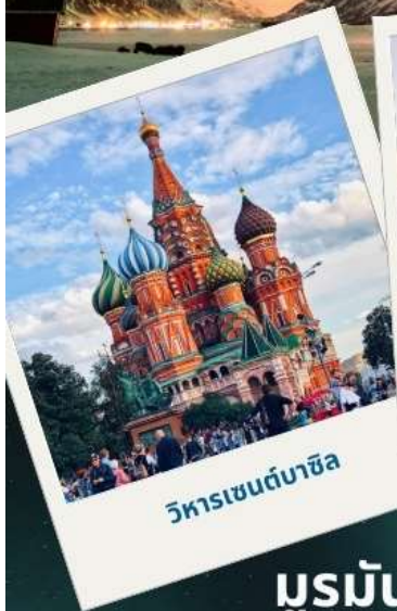
วิหารเซนต์บาซิล