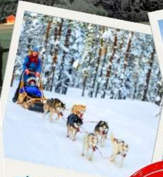
สุนัขอัสกีลากเลื่อน