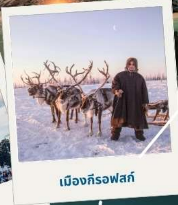
เมืองคีรอฟสค์