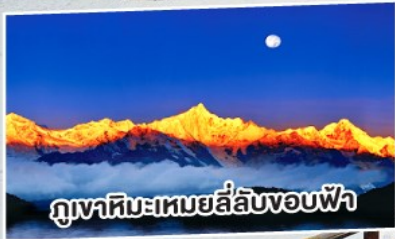
ภูเขาหิมะเหมยลี่ลับขอบฟ้า