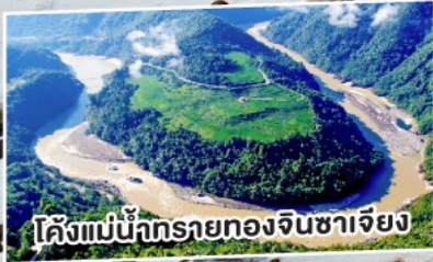
โค้งแม่น้ำทรายทองจีนซาเจียง