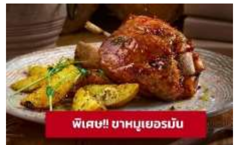
พิเศษ!! ขาหมูเยอรมัน

จากนั้นนำท่านเที่ยวชม เมืองซูก (ZUG) ประเทศสวิตเซอร์แลนด์ (ระยะทาง 259 กม. / 3.45 ชม.) เป็นเมืองที่ร่ำรวยที่สุดในประเทศ และซูกเป็นเมืองที่ติดอันดับหนึ่งในสิบของโลกเมืองที่สะอาดที่สุด อิสระช้อปปิ้งที่ Lohri AG Store ที่มีนาฬิกาชั้นนำระดับโลกให้ท่านเลือกซื้อเลือกชม อาทิเช่น Patek Philippe, Franck Muller Cartier, Omega, Tag Heuer ฯลฯ