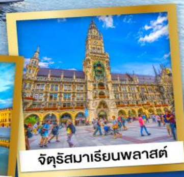
จัตุรัสมาเรียนพลาสต์