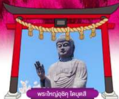
พระใหญ่อุซึคุ ไคบุคสึ