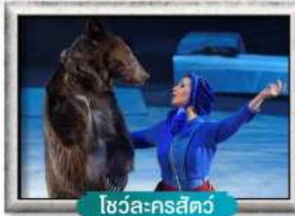
โซวล์-ครสต์ว์