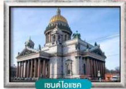
เซนต์ไอแซค