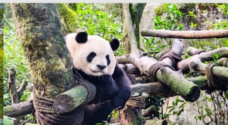
หุบเขาแพนด้าตู่เจียงเอี้ยน