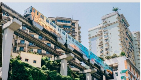
รถไฟฟ้าทะลุตึก

*ทางบริษัทฯ ขอสงวนสิทธิ์ในการสลับโปรแกรมทัวร์ตามความเหมาะสมขึ้นอยู่กับสถานการณ์หน้างาน โดยคำนึงถึงผลประโยชน์ของลูกค้าเป็นสำคัญ