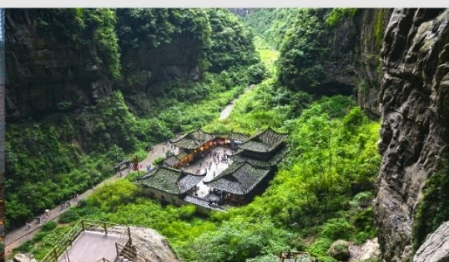
หลุมบ่อฟ้า