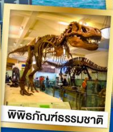
พิพิธภัณฑ์ธรรมชาติ