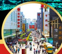
ถนนชุนชิว