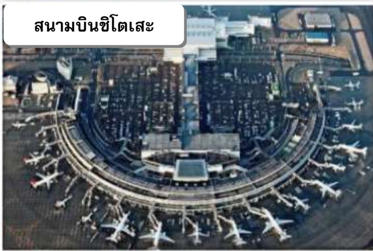
สนามบินชิตโตเสะ

เวลา 10.40 น. เดินทางถึง สนามบินชิตโตเสะ