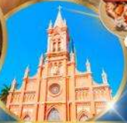
โบสถ์สีชมพู