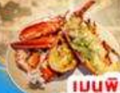
เมนูพิเศษ! "กุ้งลือบสเตอร์"