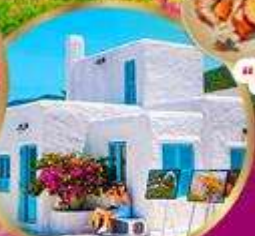
มารีนา คาเฟ่