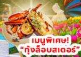
เมนูพิเศษ! "กุ้งล็อบสเตอร์"