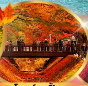
อุโมงค์เมเปิ้ล