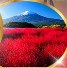
โออิชิ พาร์ค