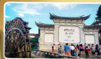
เมืองเก่าลี่เจียง