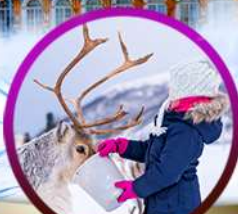
Sami Village Murmansk