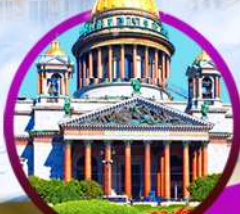
St. Isaac's Cathedral

นั่งรถไฟความเร็วสูง SAPSAN (เซนต์ปีเตอร์สเบิร์ก > มอสโก)