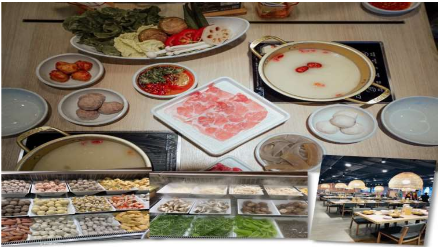
เที่ยง รับประทานอาหารเที่ยง 101 (3) เมนูชาบู