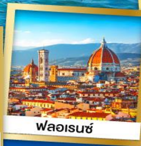
ฟลอเรนซ์