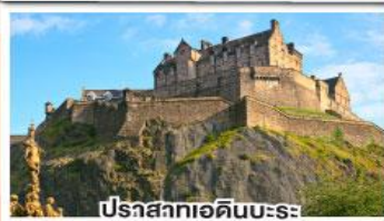
ปราสาทเอดินบะระ