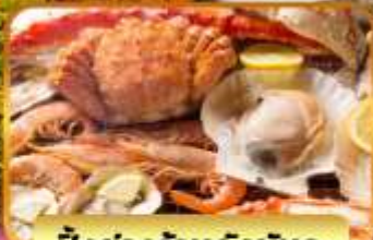
บึงย่างร้านดังนั้นตะ