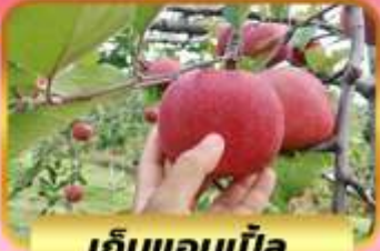
เก็บแอมเบิ้ล