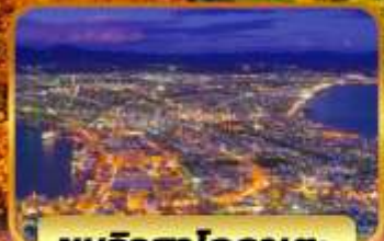
ชมวิวฮาโกดาเตะ