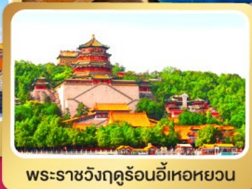
พระราชวังฤดูร้อนอ้อเหอหยวน