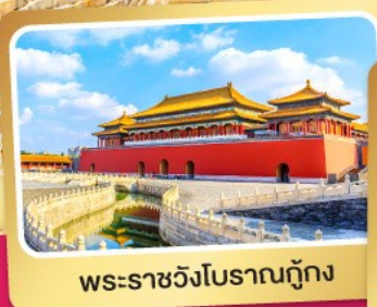
พระราชวังโบราณถู่กง