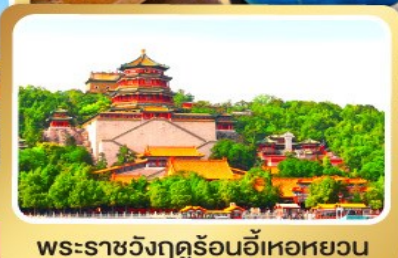
พระราชวังฤดูร้อนอี้เหอหยวน