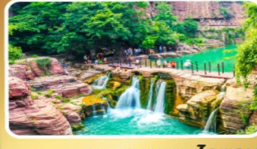
อุทยานหยุนโกซ่าน