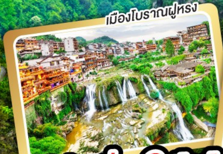
เมืองโบราณฟูหลง