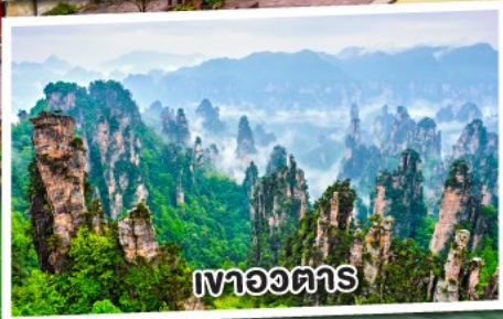
เหวอวตาร