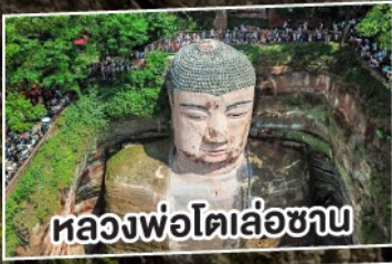
หลวงพ่อโตเล่อซาน