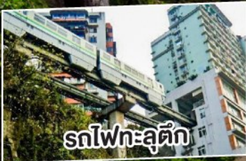
รถไฟเหาะตุ๊ก