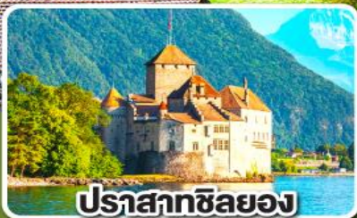
ปราสาทซิลยง