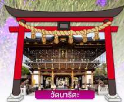
วัดนาริตะ