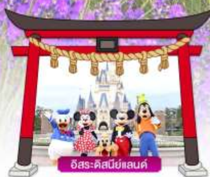
อิสระ-คิสนีแลนด์