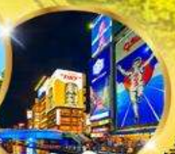
ช้อปปิ้ง ชินโซบาชิ