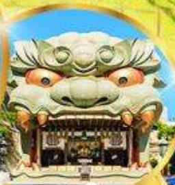
ศาลเจ้า ฟุชิมิ อินาริ