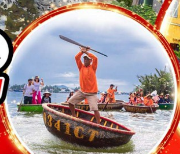
นั่งเรือกระดิง Hoi an