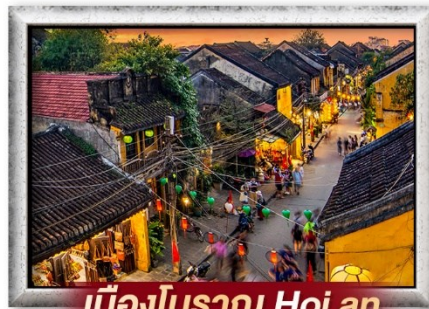
เมืองโบราณ Hoi an