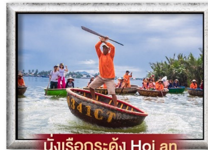
นั่งเรือกระดิง Hoi an