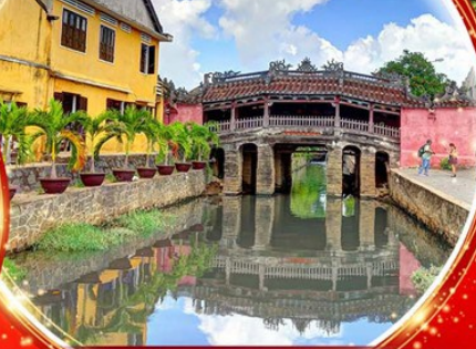
เมืองฮอยอัน