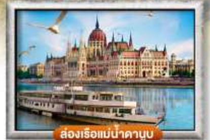
สองเรือแม่น้ำดานูบ

พิเศษ!! ลิ้มลองเมนูประจำชาติ ทั้ง 5 ประเทศ!!!