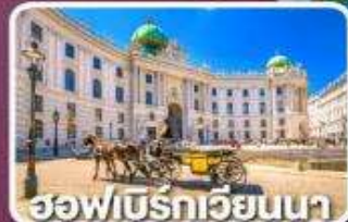
ฮอไฟเบร็กเวียนนา

ตามรอยซีรีส์ Crash Landing on you ที่ทะเลสาบเบรียนซ์