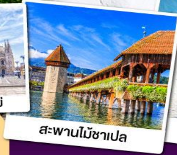
สะพานไม้ชาเปลา