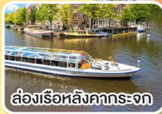
ล่องเรือหลังคากระจก

พิเศษ!! เมนูหอยแมลงภู่อบไวน์ขาว ล่องเรือหมู่บ้านไรกันน ที่รูน