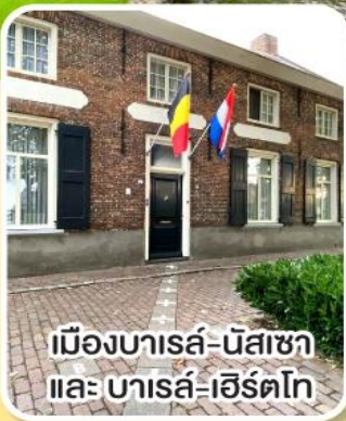
เมืองบารล-นัสซา และ บารล-เฮิร์ตโท