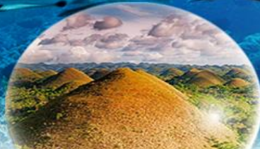
CHOCOLATE HILLS เกาะโบโฮล