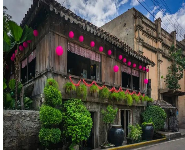
กลางวันรับประทานอาหารกลางวัน ณ โรงแรม

- Magellan's Cross เป็นไม้กางเขนศักดิ์สิทธิ์ ซึ่งปลูกโดยนักสำรวจชาวโปรตุเกสและชาวสเปนตามคำสั่งของ Ferdinand Magellan ครั้งเมื่อเดินทางมาถึงเมือง Cebu ในฟิลิปปินส์ในวันที่ 16 (American Date) 17 มีนาคม 1521