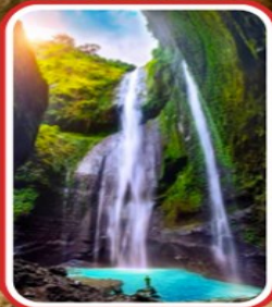
ชมความงดงาม น้ำตกมาดาคาริปุระ