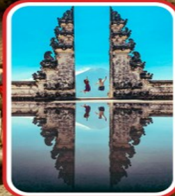
ไฮไลท์แห่งบาหลี ชมประตูวัดเลมบูยาค์