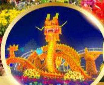
สะพานมังกรพันไฟ