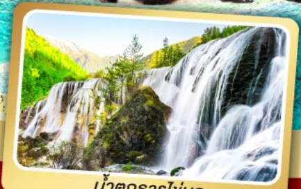
น้ำตกธารโง่บูก