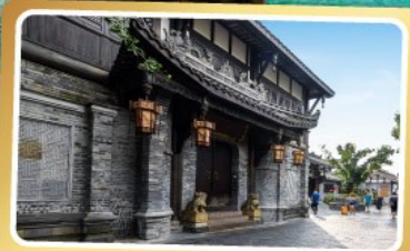
ถนนความใจเซียงจื่อ