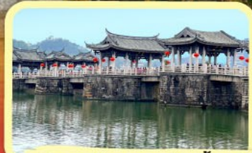
• สะพานโบราณกว้างจี