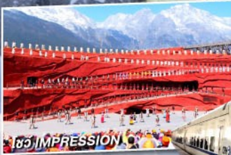
ชิว IMPRESSION LIJIANG