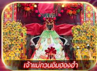
เจ้าแม่กวนอิมสองอ้า