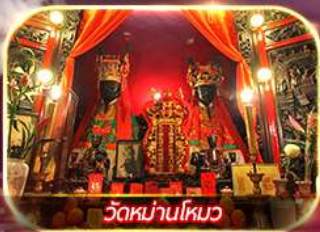
วัดหม่านโหมว