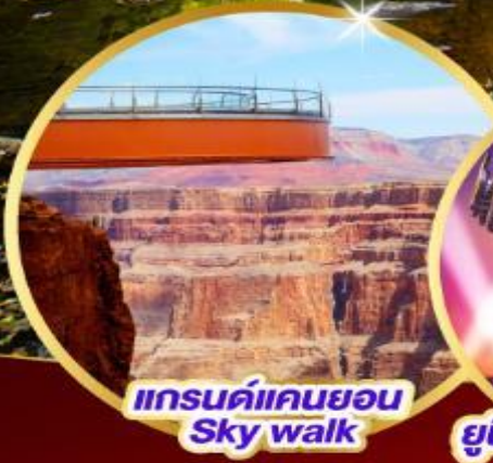
แกรนด์แคนยอน Sky walk