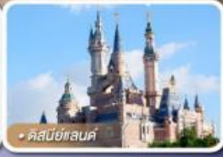
คัสมีย์แลนด์