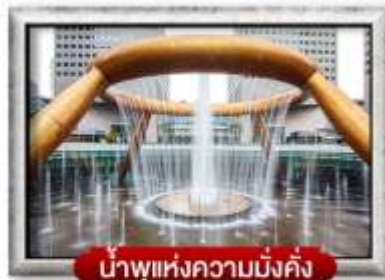
น้ำพุแห่งความมั่งคั่ง