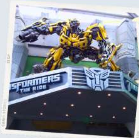
ZONE 1 : HOLLYWOOD