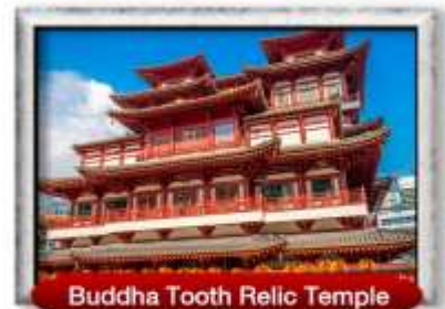
Buddha Tooth Relic Temple