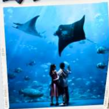
ZONE 7 : FAR FAR AWAY