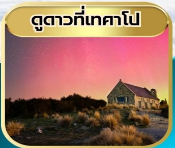
ดูทาวที่เทคาโป

จัดเต็ม!! รวมทีปคนขับรถ + ทิปหัวหน้าทัวร์ ราคาธรรมชา / รวมทุกอย่างแล้ว