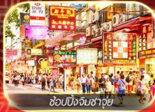
ช้อปปิ้งจิมซาจุ่ย