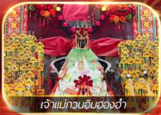
เจ้าแม่กวนอิมของฮ่า