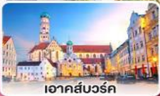
อาคส์บวร์ค

ถนนสายนี้...โรแมนติกมาก เยอรมนี ออสเตรีย 8 วัน 5 คืน