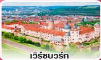
เว็ชบวร์ค